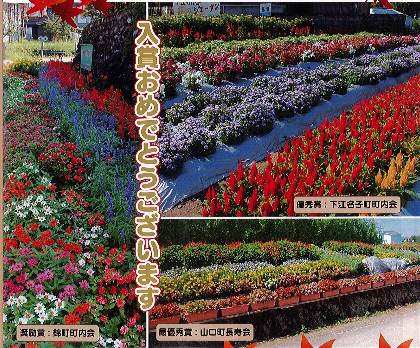
優秀賞：下江名子町町内会