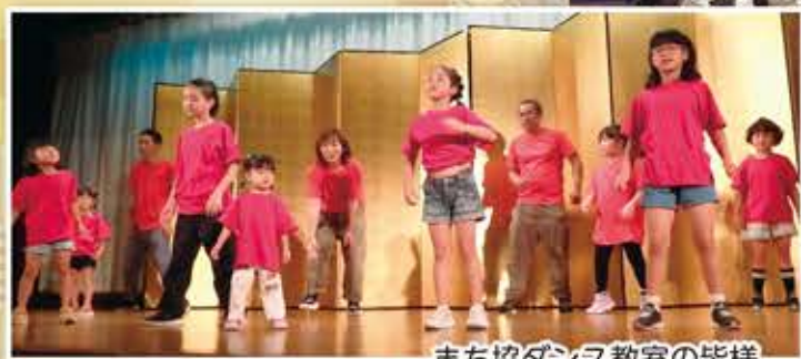
まち協ダンス教室の皆様