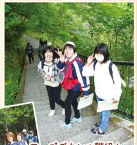
アップダウンや階段も 声掛け合ってがんばりました