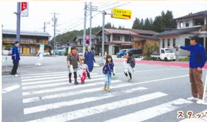
スタッフの皆様ご苦労様でした。