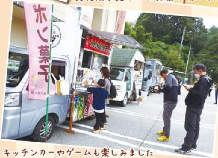
キッチンカーやゲームも楽しみました