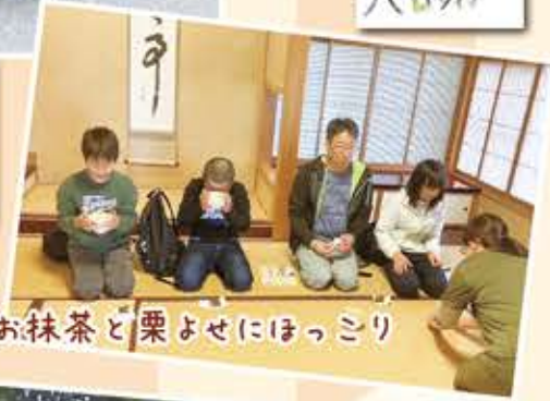
文化伝承館でのお抹茶と栗よせにほっしり