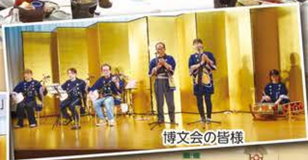
江名子校区「敬老祝賀会」