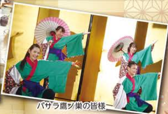
バザラ鷹ノ巣の皆様