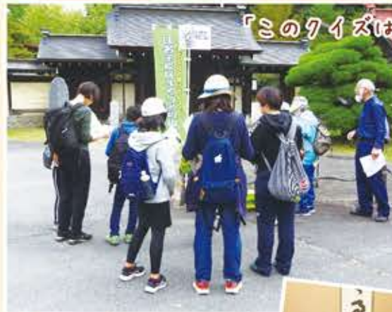
「このクイズはちょっと難しいな」