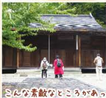
こんな素敵なおとこがあったんだね 「照蓮寺」「城山稲荷」「大隆寺」「弁天池」