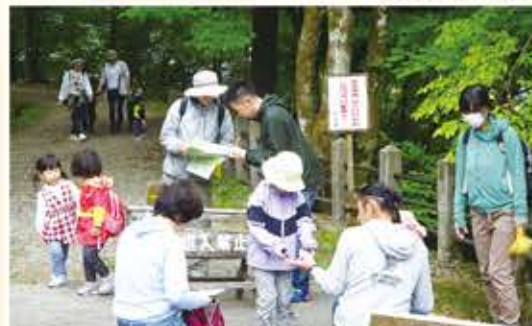
チェックポイント通過 かわいいシールをもらいました