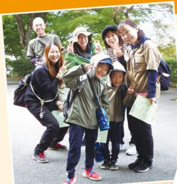
スタッフも参加者も 笑顔にあふれていました