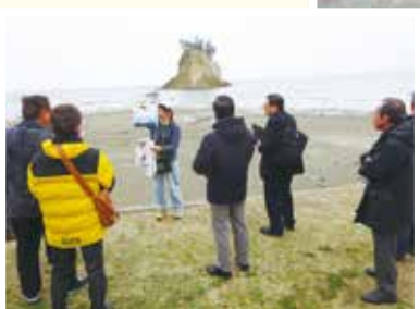
崩れ落ちた名所見附島・沈降した海岸