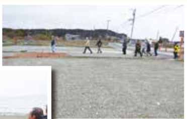
更地とした商店街

3月6～7日、「珠洲 復興支援ガイドツアー」に参加し、沈降した海岸の様子や更地となった商店街跡、仮設住宅の様子を、被災者であるガイドさんから伝えて頂きました。